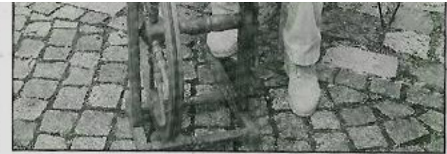
Die Wolle aus den Scher-Vorführungen wurde gleich an Ort und Stelle auf traditionelle Weise in Form gebracht.

lität". Genau davon konnte man sich an den Essensständen überzeugen: Lammsalami, Schafskäse und vor allen Dingen Lammsbraten und Lammsbratwürste kamen auf den Teller. Auf dem Schäfer- und Handwerkermarkt bestimmten Wollhausschuhe und Pullover das Bild.