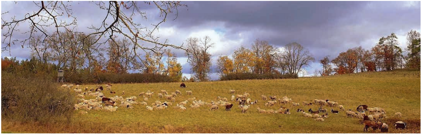
Schafherde im Herbst in Altendorf.