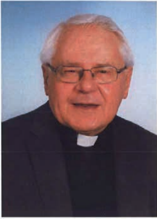
R.I.P. Vater unser - Ave Maria

"Jesus Christus, dem Herrn, sage ich Dank, dass er mir die Kraft gegeben, mich für treu befunden und in seinen Dienst gestellt hat." (Primizspruch: 1 Tim 1,12)